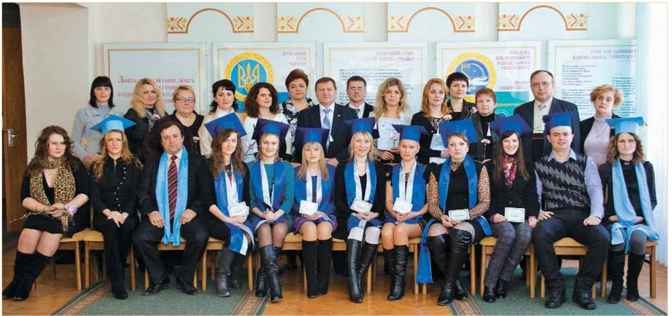
Перший випуск магістрів спеціальності «Управління інноваційною діяльністю»

Наукова діяльність викладачів широко репрезентована у збірниках статей, методичних і навчальних посібниках (за останні п'ять років їх було видано понад 400), засвідчена участю у різноманітних наукових та науково-практичних заходах в Україні та за її межами. Викладачі кафедр проводять спільні наукові дослідження із підприємствами України, підтримуються професійні й особисті контакти з іншими навчальними закладами, громадськими та владними структурами.