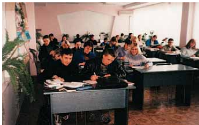
Студенти інституту у науково-навчально-методичному центрі

Навчальний процес в інституті побудований так, щоб орієнтувати студентів і викладачів на високу відповідаль-