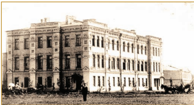
Приміщення Олександро-Миколаївської церковно-учительської семінарії (вул. Шведська Могила, 1). Фото початку ХХ ст.

За невелику суму, виділену Міністерством (3 тис. крб. на рік), було найняте скромне двоповерхове приміщення на вул. Фабрикантській, 14 (нині вул. Балакіна, 10). Ніяких «пансіонів і гуртожитків», як сказано у звіті директора, не було; усі вихованці інституту проживали на приватних квартирах. Частина студентів отримувала державну стипендію в розмірі 166 крб 66 коп. на рік. Земські стипендіати одержували по 20 крб. щомісяця, але в 1914 р. земство цих коштів не асигнувало. Лише з січня 1915 р. студентам — уродженцям Полтавської губернії, стали виплачувати 15 стипендій, з умовою, щоб за кожну річну стипендію вихованець потім відпрацював один рік за призначенням земства. Державні та земські стипендіати від плати за навчання звільнялися, а так звані «своєкошті» мали вносити щорічно 20 крб.