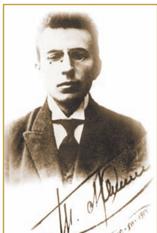
Студент Полтавського учительського інституту А. С. Макаренко, 1914 р.