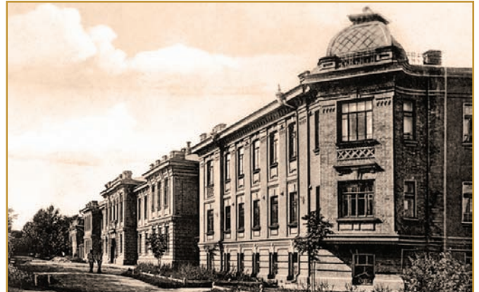
Приміщення Другої полтавської чоловічої гімназії на вул. Кіроцькій (нині Остроградського), 2. Фото початку ХХ ст.

Середню освіту молодь здобувала в гімназіях, прогімназіях, реальних і комерційних училищах. У 1916 р. таких закладів у Полтавській губернії налічувалось 34. Першу чоловічу гімназію в Полтаві заснували ще в 1808 р., Другу — в 1907 р. у будинку колишнього пансіону для збіднілих дворянських дітей на вул. Кіроцькій. Гімназія діяла до