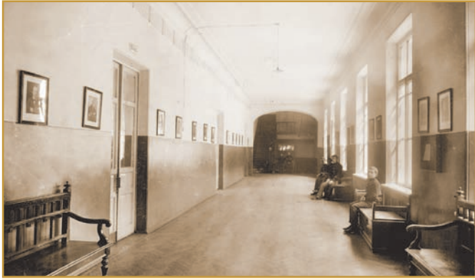
Коридор першого поверху Другої полтавської чоловічої гімназії, 1915 р.