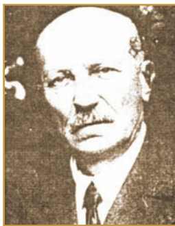
О. А. ЛЕВИТСЬКИЙ Директор Полтавського учительського (педагогічного) інституту в 1917–1919 рр.

Подвижницька діяльність ректора учительського інституту, його чітка українська позиція, інтелект сприяли утвердженню високого авторитету О. Левитського серед викладачів і студентів. Своім учителем у широкому розумінні його вважав і Антон Макаренко. До речі, коли 28 липня 1919 р. до Полтави вступили білогвардійські «добровільці», як згадує донька ректора Н. Левитська, саме А. Макаренко порадив їй батькові виїхати з Полтави. «Тяжко далася йому та втеча в невідоме, адже покидав інститут, де вперше відчув колектив однодумців, як викладачів, так і студентів».