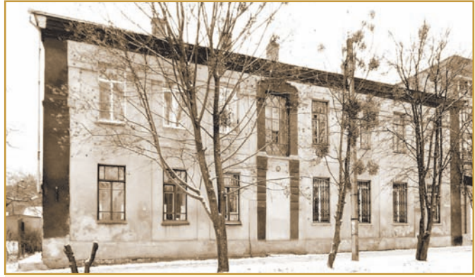
Будинок по вул. Фабрикантській (нині Балакіна), 14, де в 1914–1917 рр. розміщувався Полтавський учительський інститут. Сучасний вигляд

У 1914 р. заяви на вступ подали 122 абітурієнти, а зараховано було лише 26. Склад вступників був строкатим: 19 закінчили вчительські семінарії, решта — повітові й міські училища, педкурси або склали екзамени на звання вчителя. З 83 абітурієнтів, які працювали вчителями, було прийнято 19 осіб, зокрема й А. С. Макаренка.