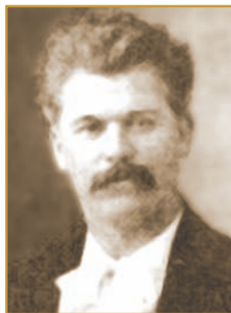
І. М. СТЕШЕНКО Педагог, громадський і державний діяч, гене- ральний секретар осві- ти УНР. Загинув у Пол- таві 1918 р.