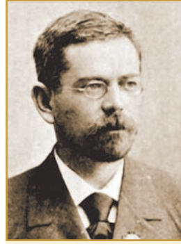
Д. І. БАГАЛІЙ Видатний український історик, організатор української науки та освіти, академік ВУАН