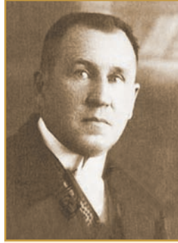
С. М. КУЛЬБАКІН Філолог-славіст, паліограф, професор, член-кореспондент РАН