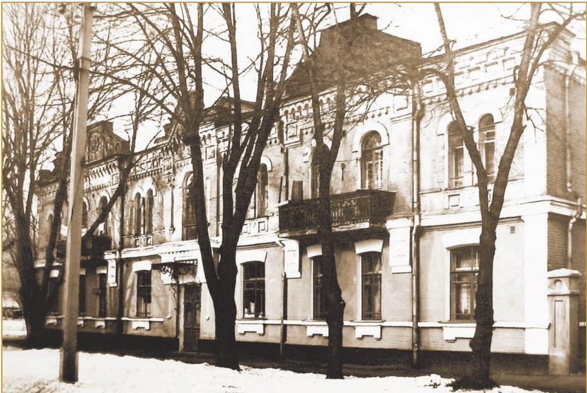
Будинок на вул. Новокременчуцькій (нині Лідова), 12, у якому в 1918–1921 рр. працював Полтавський педагогічний інститут. Сучасний вигляд

Оскільки більшовицьке керівництво не влаштувала діяльність заснованого в умовах Української революції Історико-філологічного факультету в Полтаві, 6 жовтня 1920 р. Головний комітет професійно-технічної та спеціально-наукової освіти УСРР (Укрголовпрофосвіта) прийняв постанову про об'єднання Полтавського педагогічного інституту й Історико-філологічного факультету.