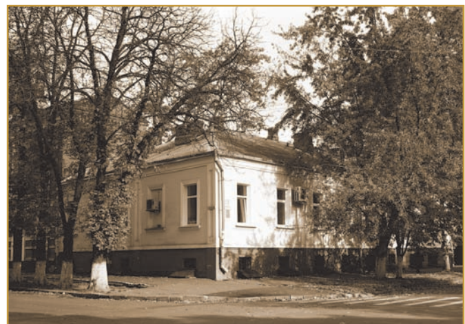
Будинки на вул. Новополтавській (нині Шевченка), 20 і Стрітенській (нині Комсомольська), 37, які у 1918–1921 рр. орендував Історико-філологічний факультет