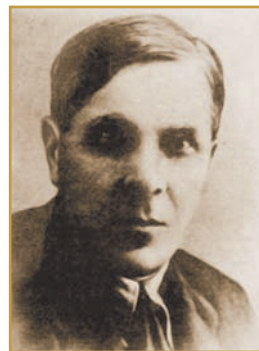
М. Я. РУДИНСЬКИЙ Архіолог, історик мистецтв