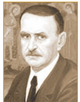
В. М. ЩЕРБАКІВСЬКИЙ Історик, архіолог, ректор Українського народного університету