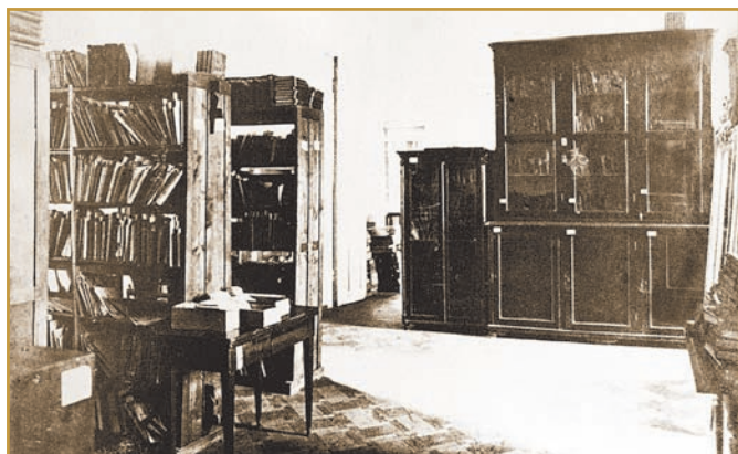
Бібліотека ІНО, 1924 р.

Соціальний стан студентів станом на 1 червня 1927 р. був таким: вихідців із селян — 58% (зокрема 39% — члени КНС), робітників — 6%, учителів та їхніх дітей — 18%, службовців — 16%, кустарів — 2%. Навесні 1928 р. при ІНО були організовані чотиримісячні курси «профтісячників» для підготовки до вступу робітничо-наймитської молоді. Із 87 курсантів при комплектуванні інституту студентами