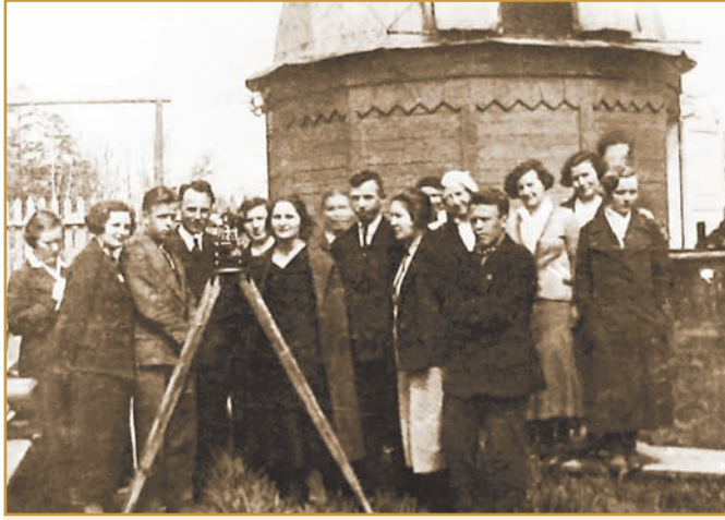
Інститутська обсерваторія, 1928 р.

учителів V–VII класів, мав такі відділення: соціально-економічне, фізико-математичне та агробіологічне. На факультеті молодшого концентру, що готував учителів початкових класів, з 1929/1930 навчального року існувало дошкільне відділення.