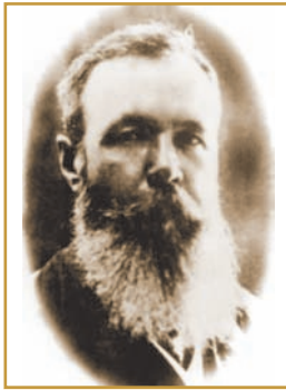
В. О. ШЕПОТЬЄВ Ректор Полтавського інституту народної освіти у квітні 1921 р.