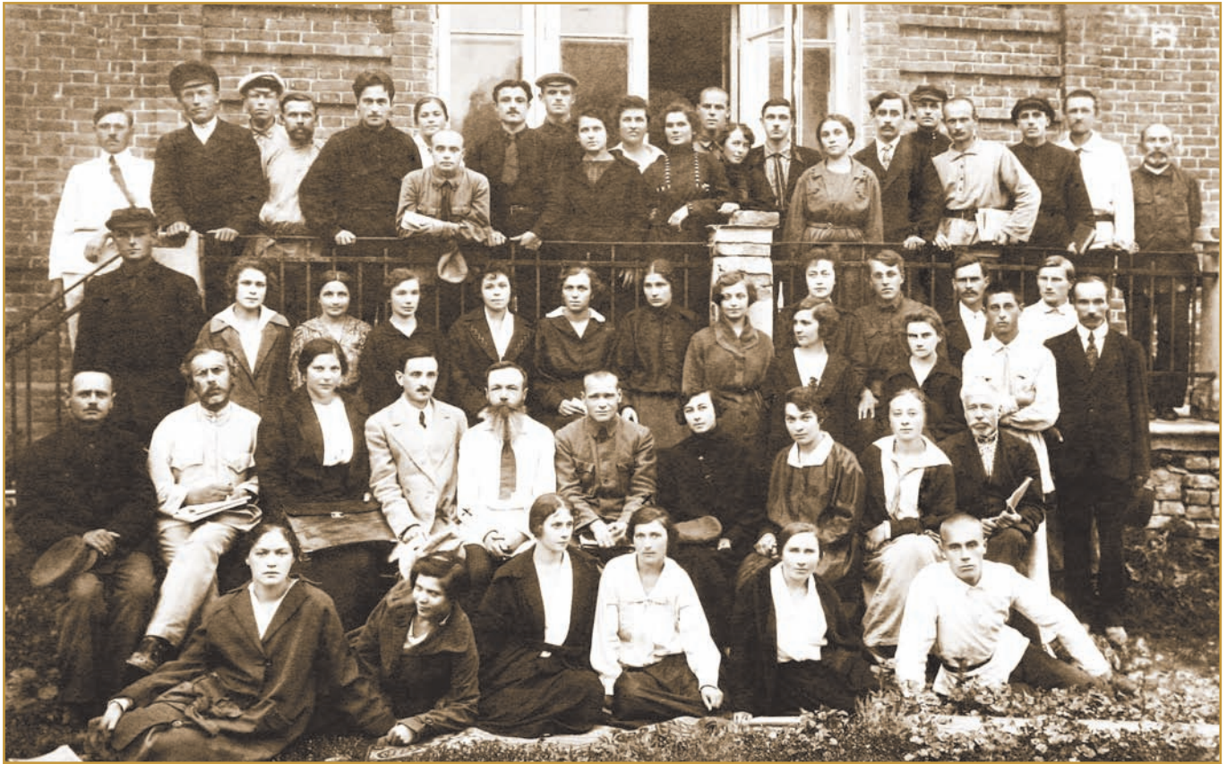
Колектив викладачів і студентів гуманітарного відділу ІНО, 1924 р.

зарахували 59 осіб. Решту слухачів курсів було прийнято на робітфак, який розпочав роботу наступного навчального року. Створення робітфаку відразу ж позначилося на соціальному складі студентів. Серед них збільшилося число робітників і селян-бідняків. У 1929/1930 навчальному році з 821 студента ІНО та робітфаку було (у відсотках) робітників і їхніх дітей — 24,5, наймитів — 4,2, селян-бідняків — 19,5, середняків — 16,3, трудової інтелігенції (учителів) — 19,2, службовців — 15,3, кустарів — 1.