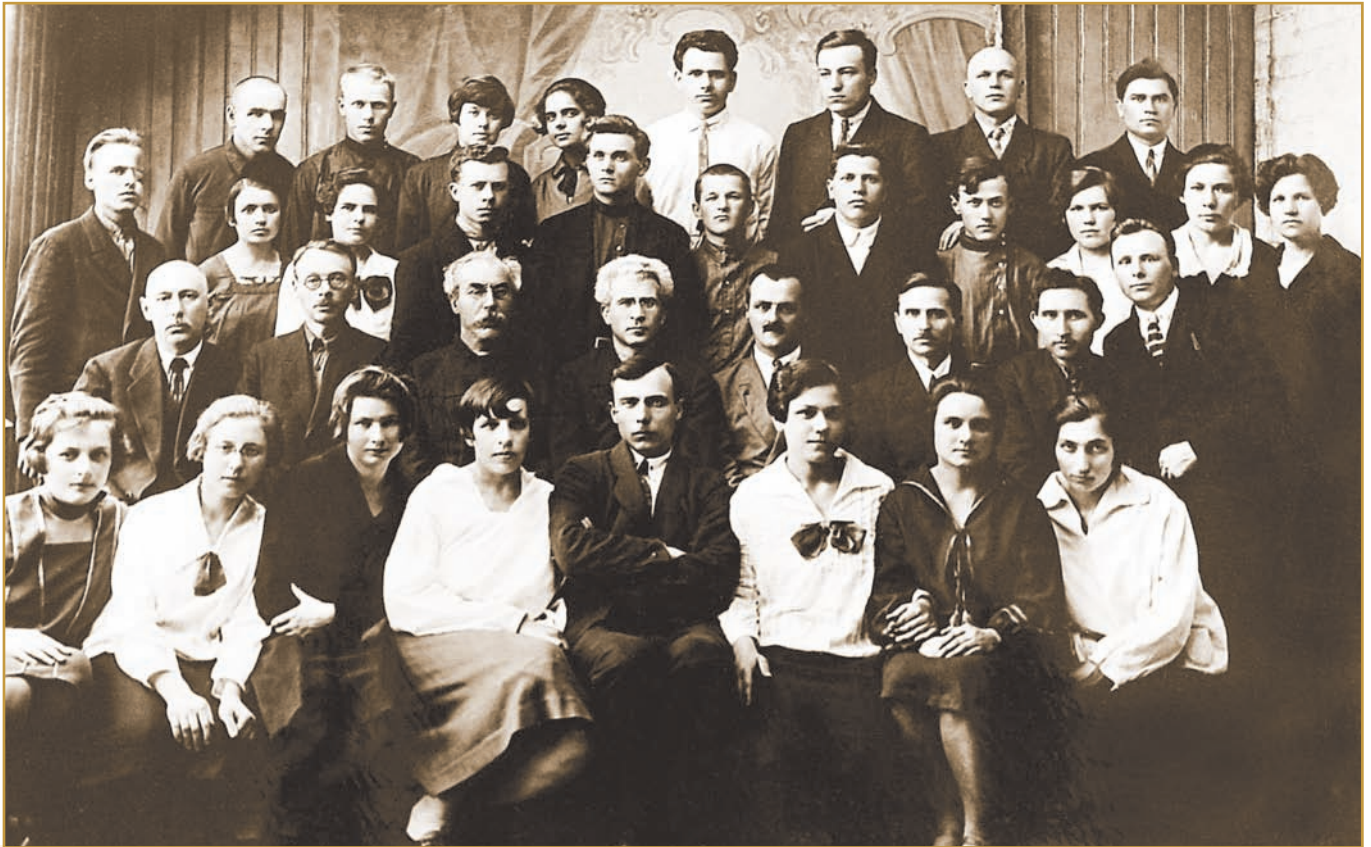
Випуск студентів ІНО, 1930 р.

дачі та студенти інституту. Тільки в 1929 р. колектив ІНО домігся ліквідації неписьменності серед 322 осіб. В умовах здійснення політики українізації, навчання неписьмених проводили рідною для них мовою.