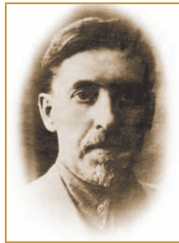
О. А. ПОБЕДОНОСЦЕВ Провідний фізик інституту (1923–1928 рр.), батько видатного вченого в галузі ракетно-космічної техніки Ю. О. Победоносцева

Значна частина абітурієнтів вступала до ІНО за направленнями різних організацій. Так, у 1925 р. на 120 місць прибуло 155 осіб, із яких 34 зараховано без екзаменів. Серед зарахованих на навчання (127 осіб) було: відряджених органами КП (б) У — 6, ЛКСМУ — 7, профспілками — 70, комнеза-