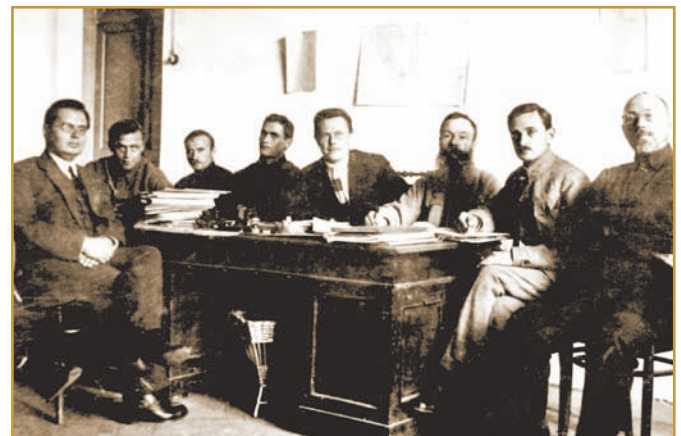
Правління Полтавського ІНО, 1924 р.

У 1926/1927 навчальному році розпочинається перехід на чотирирічний термін навчання. З третього курсу вводилася часткова спеціалізація в галузі суспільствознавства, природознавства та математики. 1928/1929 навчального року в зв'язку зі злиттям ІНО та педтехнікуму створюються факультети молодшого та старшого концентру. Факультет старшого концентру, який готував