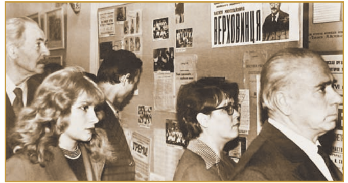
На виставці в Будинку композиторів, крайній зліва Г. П. Пінчук, випускник Полтавського ІНО 1930 р., міністр освіти УСРР (1949–1958). Фото 70-х рр.

Керівниками закладу в той час були члени партії К. П. Жагар і Р. П. Куліненко, яких на посаду директора ІСВ призначив Наркомат освіти УСРР. Карл Петрович Жагар (1883–1938) народився в маєтку Феймана Вітебської губернії. Отримав незакінчену вищу освіту, навчаючись на фізико-математичних факультетах Київського та Одеського університетів. Був учителем математи-