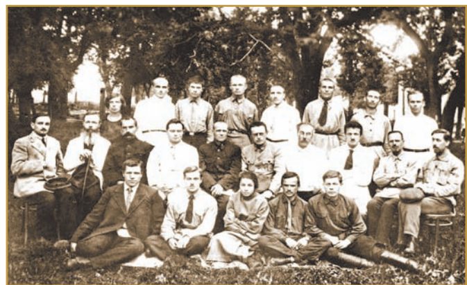
Випуск студентів ІНО, 1924 р.