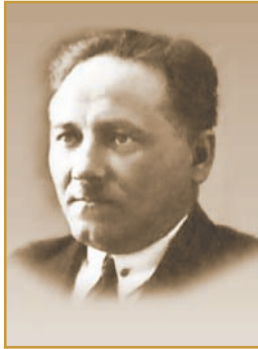
К. П. ЖИГАР Ректор Полтавського ІНО в 1923–1925 рр.