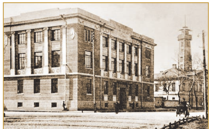
Навчальний корпус ІНО на вул. Луначарського, 2, де в кінці 20-их – у 30-их рр. розміщувався історико-філологічний факультет. Фото початку ХХ ст.