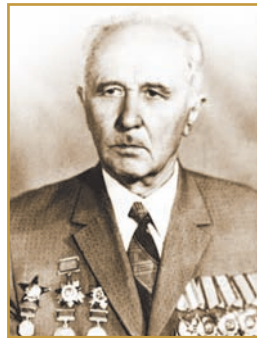
М. В. ПАСІЧНИК Випускник фізико-математичного факультету Полтавського інституту соціального виховання 1931 р., майбутній академік АН УРСР. Фото 60-х рр.