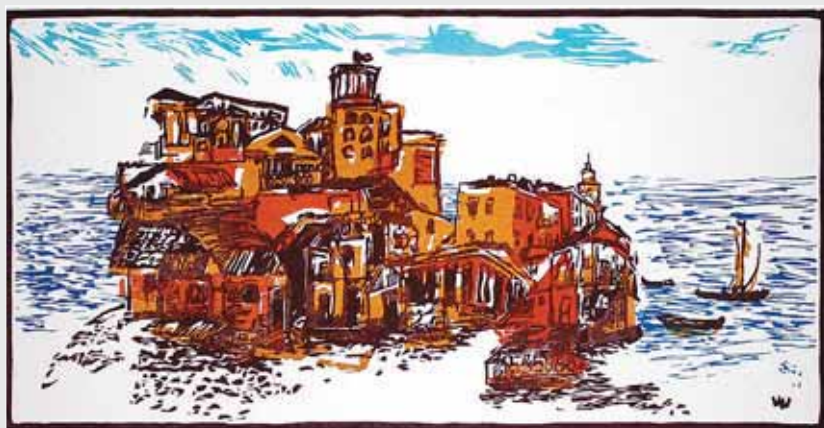
▲ Н. Віберг. Місто біля моря. Ліногравюра. 2010