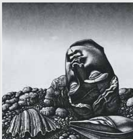
▲ Я. Миськів. Берег Херсонеса. Офорт, 32х32. 1981