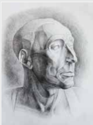
▲ А. Нечипорук. Гіпсова голова Ніколо да Удзана. Папір, олівець, 60х40. 2009