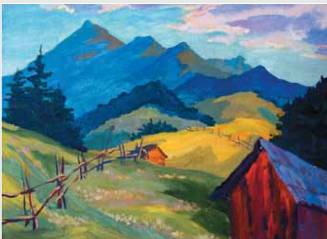
▲ Р. Лучук. По дорозі на Смотрич. Полотно, олія, 50x69. 2010