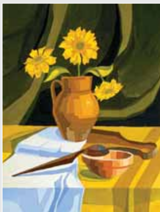
▲ Н. Савчак. Натюрморт. Папір, гуаш, 60х40. 2008