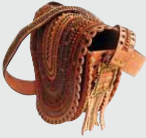
▲ Ю. Ходан. Сумка жіноча. Шкіра, металеві капслі, 30x25x8. 2011