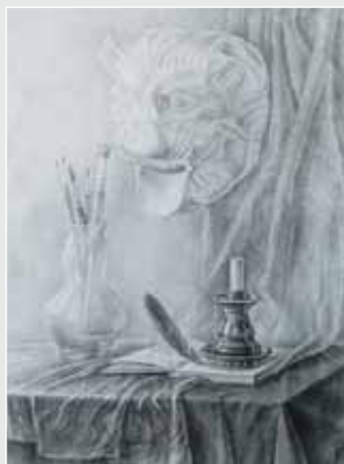
▲ М. Катаран. Натюрморт з гіпсовою маскою. Папір, олівець, 60х40. 2009