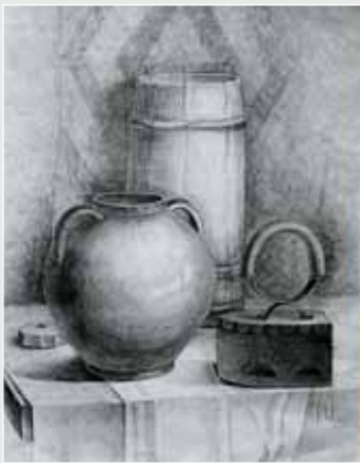
▲ Л. Менчинська. Натюрморт. Папір, олівець, 60x40. 2009