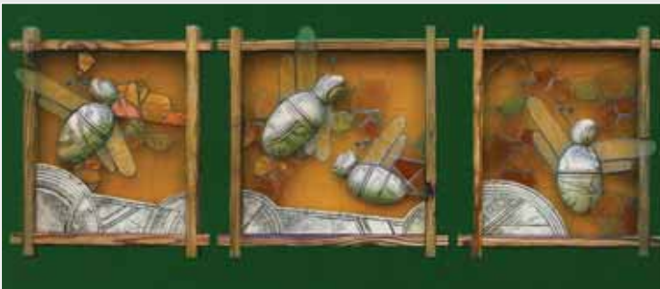
▲ Подружжя Захарків. Янголи сонця. Шамот, вітражне скло, 38,5x44,5; 44,5x44,5; 38,5x44,5. 2004