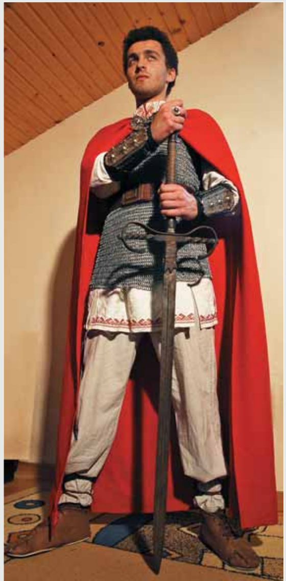
▲ О. Юсипчук. Реконструкція костюма (наручі, чепрага, перстень). Мельхіор, латунь, сталь. 2010