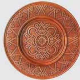
▲ В. Ходан. Декоративна таріль. Груша, інкрустація бісером, d 52. 2008