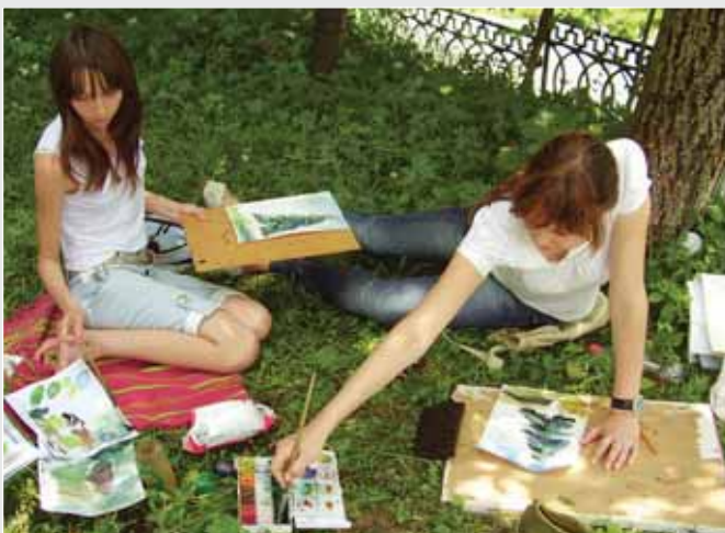
▼ На пленері ▼ Заняття з рисунку. Лінійно-конструктивне вирішення. Тема: капітель

Базою навчання в Косівському училищі прикладного та декоративного мистецтва завжди була і залишається народна традиція. Вагомим внеском у становлення професійної школи був творчий доробок місцевих майстрів, а також багаторічна кропітка праця колективу висококваліфікованих професійних художників і педагогів. Відтак із близько 2500 випускників навчального закладу третина — члени Спілки художників України, дві тисячі — учасники регіональних, всеукраїнських та міжнародних виставок, серед них лауреати міжнародних і державних премій, володарі дипломів різних ступенів та інших нагород.