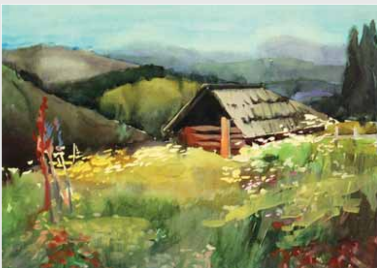
▲ Ю. Юрчишин. При дорозі. Папір акварельний, акварель, 40x60. 2010