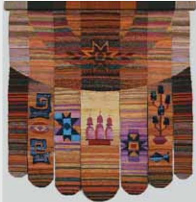
◀ О. Мельникова. Весільний рушник. Напіввовна, бавовна, 250x40. 2010