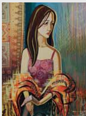
▲ А. Чубай. Декоративне вирішення сидячої фігури в легкому одязі. Папір, гуаш, 60x40. 2010

Цикл гуманітарних та соціально-економічних дисциплін забезпечує розвиток інтелектуальних здібностей студентів, формування наукового світогляду, виховує логічне творче мислення, культуру мови, мораль, естетичний смак.