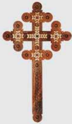
▲ Б. Радиш. Хрестик. Горіх, 42x24. 2008