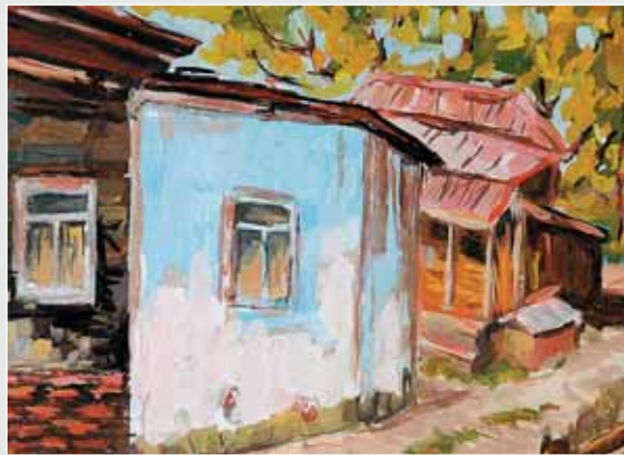
▲ І. Заячук. Околиці Косова. Папір, гуаш, 40x60. 2010