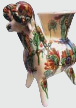
▲ О. Чорний. Вазон. Глина, барвники, полива, h 30. 2011