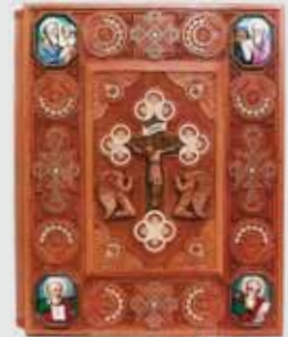
▲ В. Ходан. Оклад до Євангелія. Груша, інкрустація бісером та деревом, 45x30. 2005