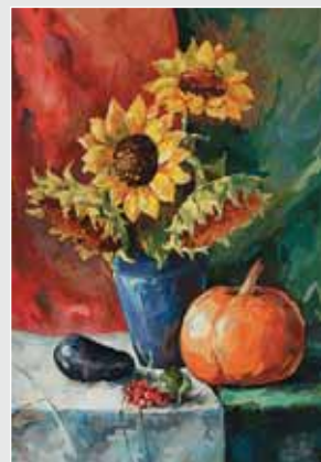
▲ А. Нечипорук. Натюрморт. Папір, гуаш, 60х40. 2010