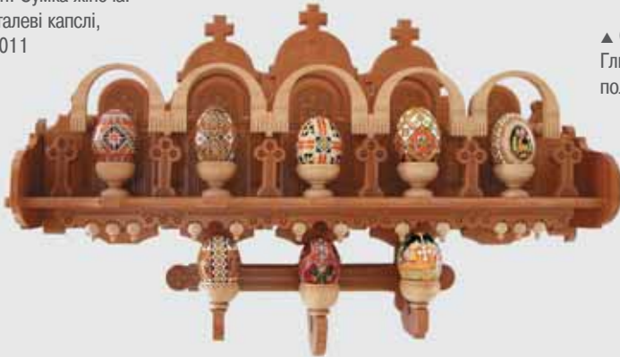
▲ М. Радиш. Писанник. Груша, 62x22. 2002