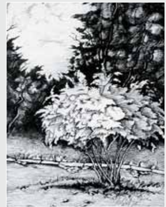
▲ О. Грона. Куц калини. Папір, туш, перо, олівець, 30x20. 2010