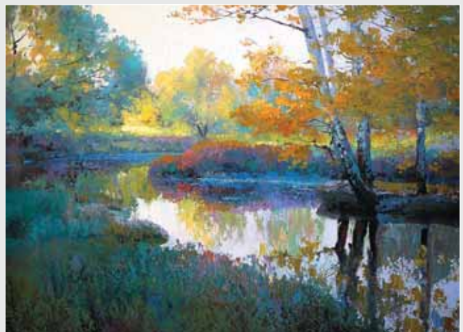
▲ А. Григоруک. Ставок. Полотно, олія, 50x70. 2010