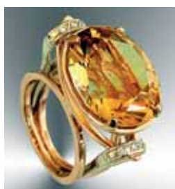
Перстень. Біле та жовте золото, цитрин