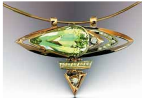
Кольє «НЛО». Біле та жовте золото, діаманти, бірил