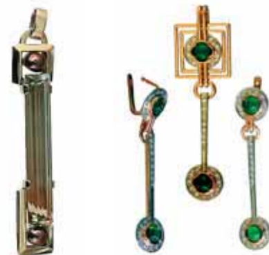
Підвіска «Рівновага». Біле золото, топаз, чорні перлини Жіночий гарнітур. Хром, діапсиди, діаманти