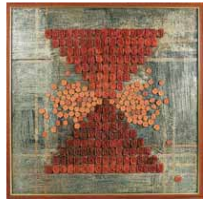
► Гра в бісер. Левкас, теракота, 52x52. 2009