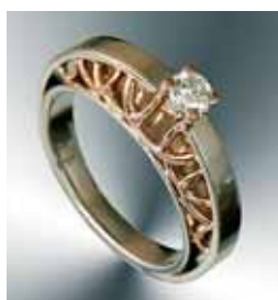
Перстень. Біле та жовте золото, діамант