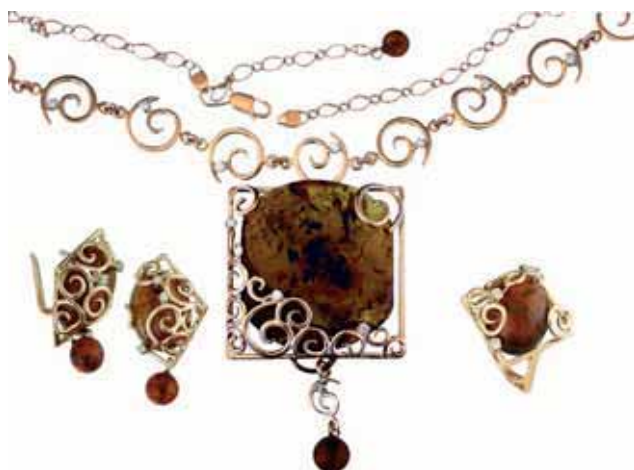
Гарнітур «Равлики». Бурштин, циркони, біле та жовте золото