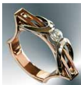
Перстень. Біле та жовте золото, діамант