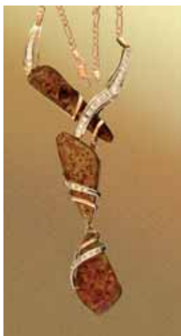
Кольє «Бурштинова фантазія». Бурштин, біле та жовте золото