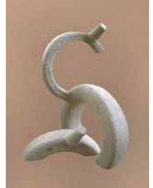
▲ Карпатський олень. Гончарне коло, шамотна маса, 45x25. 2009