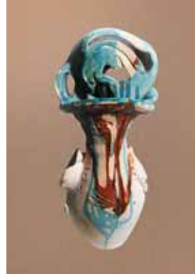
▲ Цвіт папороті. Глина, гончарне коло, поливи, 30x15. 2010