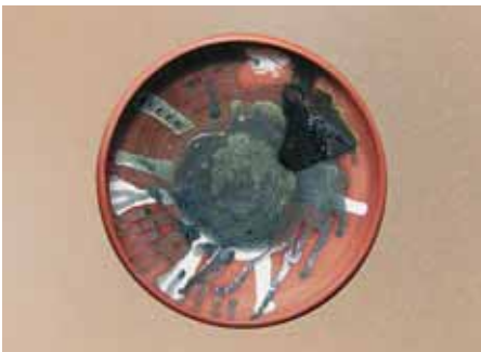
▲ Миска Ведіння. Глина, гончарне коло, поливи, д 30. 2010

Коло його мистецьких зацікавлень — надзвичайно широке: крім гончарства, яке було його мрією з дитинства і стало офіційним фахом, він виготовляє вироби з кованого металу, займається аналоговою фотографією, живописом, експериментує з різними матеріалами на основі їх технологічних особливостей.