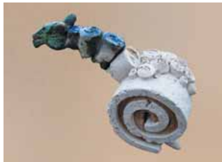
▲ Кінь-меандер. Глина, шамотна маса, ручна ліпка, емалі, 20x10. 2010