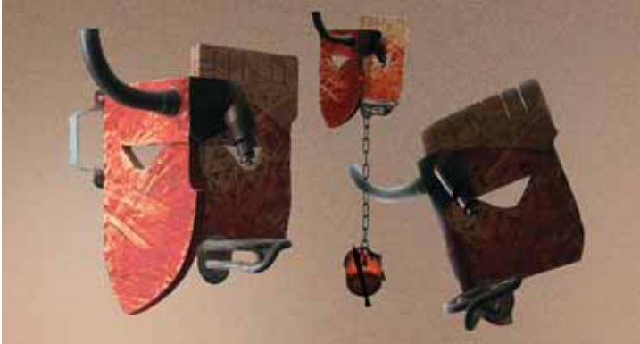
▲ Автопортрет. Дерево, мідь, акрил. Інсталяція. 2008