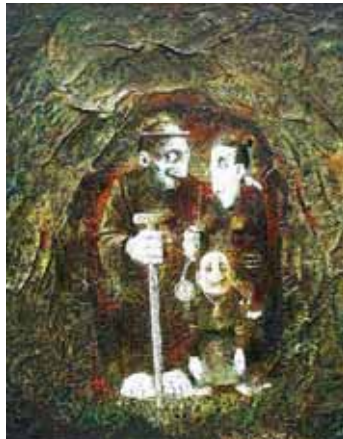
◀ Епопея Хотинської війни 1621 р. «Хотинська битва», фрагмент. Авторська техніка, полотно, олія, 200х360. 2004–2005 ▲ Сліпі. Авторська техніка, полотно, олія, 100х90. 1996 ▶ Вознесіння. Полотно, олія, 175х120. 1993–1994