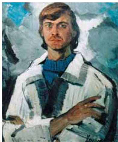
▲ Народний артист України Іван Миколайчук. Полотно, олія, 77х65. 1970

► Із серії «Будинок творчості ім. К. Коровіна». Полотно, олія, 80х60. 1987