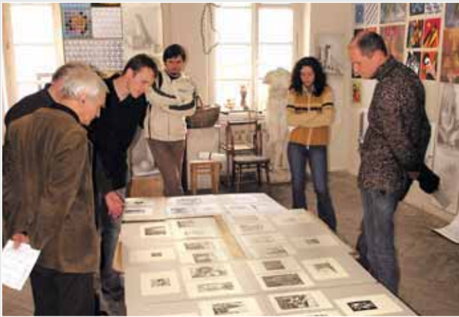
▲ Під час перегляду курсових робіт