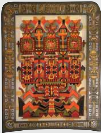
▲ О. Андрущенко. Феєрія духу. Скло, туш, олія, 47x34. 2004