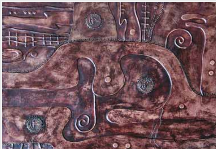
◀ І. Грицюк. Сукня «Барви осені». Вовна, вишивка гладдю. 1990