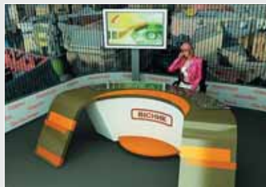
▲ Н. Ульгурський. Студія телебачення