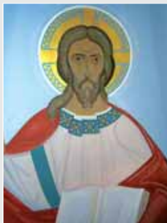
▲ Р. Студницький. Пантакратор. Фрагмент поліхромії храму Успіння Пресвятої і Праведної Анни (м. Львів). Акрил. 2010