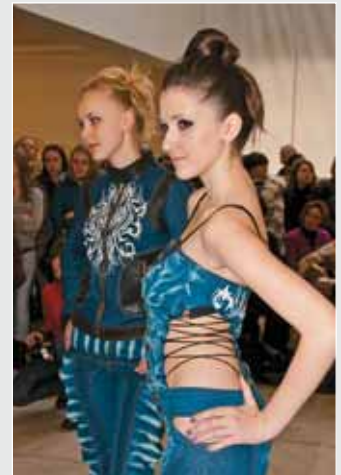
▲ Н. Таравська. Молодіжна колекція у стилі «Денім». 2010