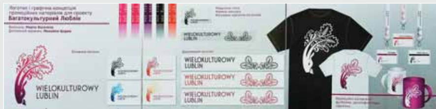
▲ М. Васеліна. Дипломна робота «Багатокультурний Люблін». 2010