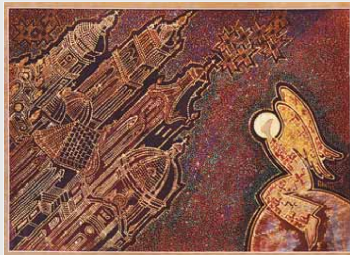
◀ Л. Іванів. Святовий ансамбль. Креп, вишивка. 2008 ▲ Г. Зубченко. Спостереження. Батік. 2000 ▶ І. Жук. Сценічний чоловічий комплект. Вовна, атлас. 2000