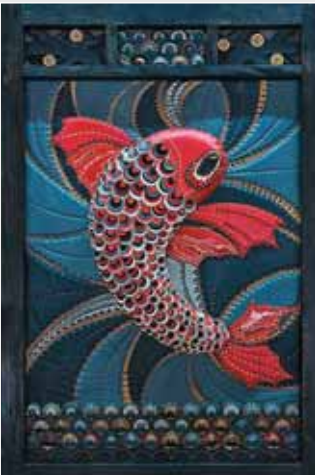
▲ І. Малофій. Декоративний пласт зі шкіри. 2010