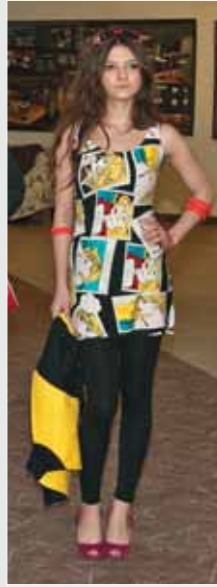
▲ А. Васильченко. Молодіжний комплект одягу у стилі поп-арту. 2010