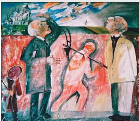
▲ М. Безпальків. Ангели перелітають. Темпера, 70x65. 2008