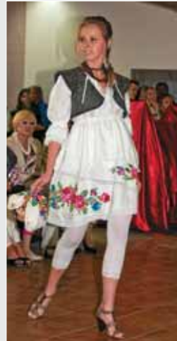
▲ А. Кітик. Молодіжний комплект одягу в етностилі. 2010