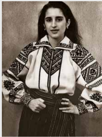
▲ С. Заблоцька. Жіноча сорочка «Сокальчанка». Льон, вишивка. 2000