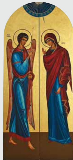
▲ А. Мельник. Ікона благовіщення. Дерево, левкас, темпера, позолота, 140x65. 2010