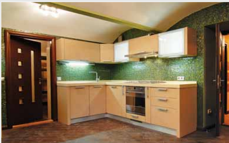
▼ Р. Студницький. Дизайн інтер'єру індивідуального житла. Кухня. Львів. 2009

Факультет «Дизайн» бере свій початок від кафедри проектування інтер'єрів, яка у 1946 р. називалася меблево-інтер'єрною. Згодом вона багато разів змінювала свою назву: художньої обробки дерева, проектування інтер'єру та меблів, проектування інтер'єру. У різний час тут викладали такі знакові в історії українського мистецтва особистості, як М. Курилич, М. Яців, М. Вендзилович, В. Любченко. Кожен із них зробив вагомий внесок у становлення і формування львівської академічної школи. Зокрема методика вивчення основ композиції, становлення цього предмета як визначального у розвитку майбутніх митців — заслуга М. Курилича та М. Яціва.