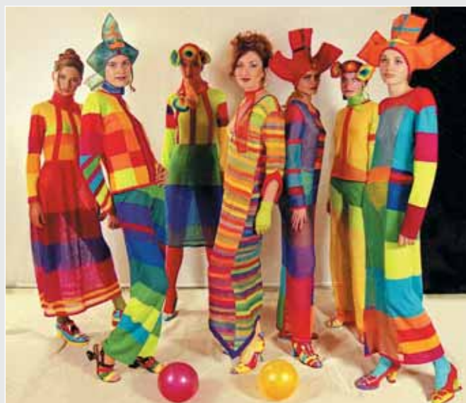
▶ Л. Рудик. Колекція одягу «ЕФ-промені». Трикотаж, аплікація. 1998