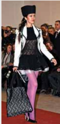
▲ С. Свистун. Молодіжні святкові комплекти одягу за мотивами угорського костюма. 2010