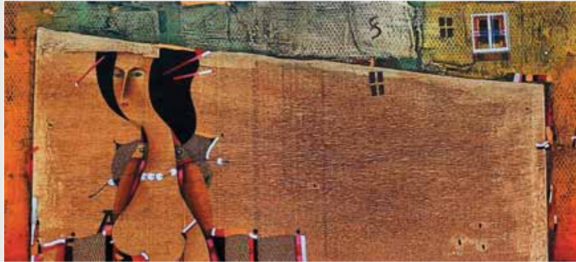
▲ Б. Пікулицький. Для Утамаро. Авторська техніка, 14x29. 2005