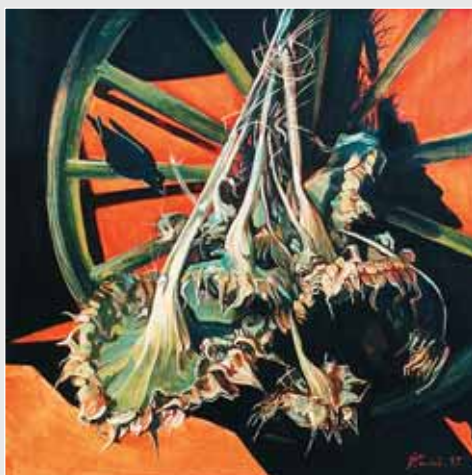
▲ Т. Салій. Сухі соняшники. Полотно, олія, 80x80. 2009