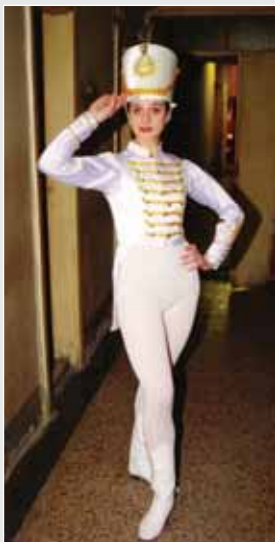
▲ О. Коровицький. Сценічний костюм для балету. Шовк, трикотаж, аплікація. 1998