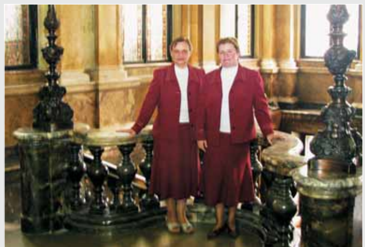
▲ О. Федина. Фірмовий стиль одягу наглядочок виставкових залів Львівського державного музею етнографії та художнього промислу ІН НАН України. 2008