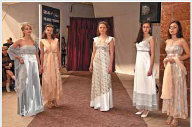
▲ Н. Сидор. Колекція жіночого святкового вбрання. 2010