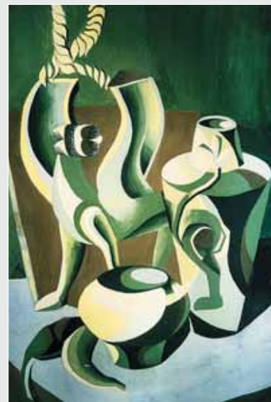
▲ О. Козакевич. Натюрморт. Папір, гуаш, 45x65. 2005