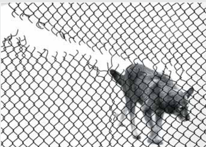
▲ В. Косів. По той бік досяжності. Фото-графіка, 30x40. 2002

З 1998 р. працює у ЛНАМ викладачем, згодом — старшим викладачем, головою методичної ради кафедри графічного дизайну. У 2003 р. обраний завідувачем кафедри графічного дизайну.