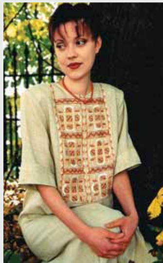
▲ З. Тканко. Святова сукня. Льон, шовк, ручна вишивка гладдю, виколювання. 2003