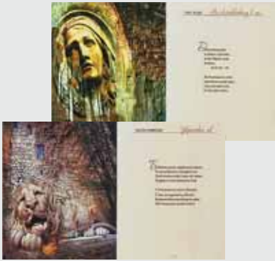
▲ Г. Павельчак. Фрагмент дипломної роботи. Мішана техніка. 2010