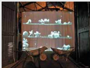
▲ О. Хорошко. Відеоінсталяція