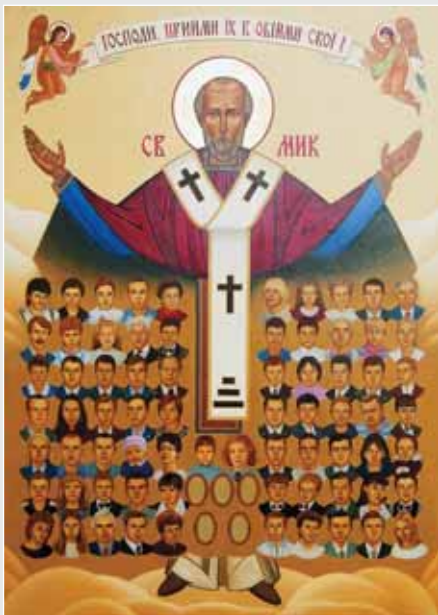
▲ М. Солтис. Ікона «Господи, прийми в обійми свої». Каплиця жертв Сквиливської трагедії

викладачів кафедри проектування інтер'єру