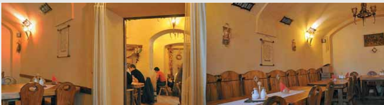
▲ І. Винницька. Інтер'єр ресторану