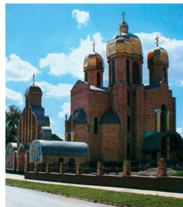
Собор Єднання Заходу та Сходу (авт. М. С. Білик)

Своїм життєвим кредо, що якнайвлучніше характеризує його професійний шлях, Мирослав Білик обрав відомий вислів: « Feci quod potui, faciant meliora potentes! » (Я зробив усе, що зумів, хто зможе краще — нехай спробує!), — так говорили римські консули, завершуючи свій виступ у Сенаті.