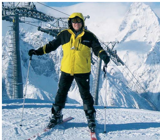
3300 м перед спуском. Домбай

Його життєве кредо: «Будь-які перешкоди можуть бути перетворені на щаблі, що ведуть до успіху».