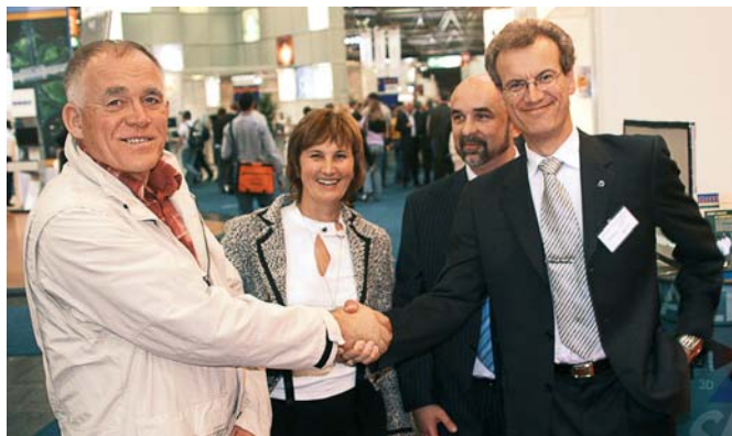
Укладання угоди із президентом фірми «Orptech Canada»