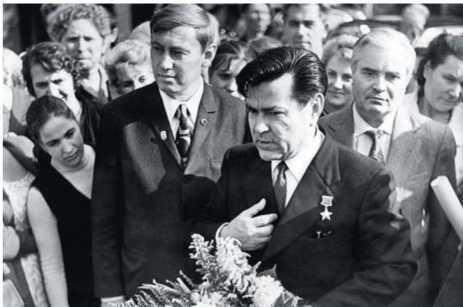
Секретар Сумського обкому Компартії України М. М. Ольшанський із льотчиком, Героєм Радянського Союзу О. П. Марсьєвим, 1976 р.

У 1973 р. М. М. Ольшанського обрали секретарем Сумського міського комітету Комуністичної партії УРСР.