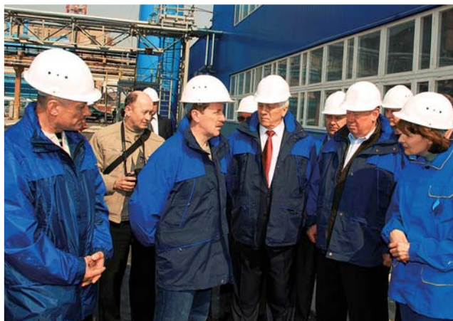
Депутат Державної Думи Російської Федерації М. М. Ольшанський (другий справа) і міністр сільського господарства Російської Федерації О. В. Гордєєв (другий зліва) на будівництві комплексу з виробництва нових видів мінеральних добрив у Воронежській області

на підприємстві «Азот» у м. Рівне, у ВО «Стирол» у Горлівці та ВО «Азот» у Черкасах і Северодонецьку.