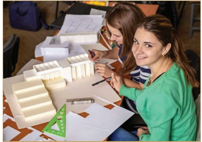
Студенти під час макетування (кафедра архітектурного проектування)

чу співпрацю з Віденським технічним університетом організовано низку міжнародних науково-практичних семінарів з урбаністичної тематики у Львові, на Південному узбережжі Криму, в Харкові, Одесі, Відні тощо.