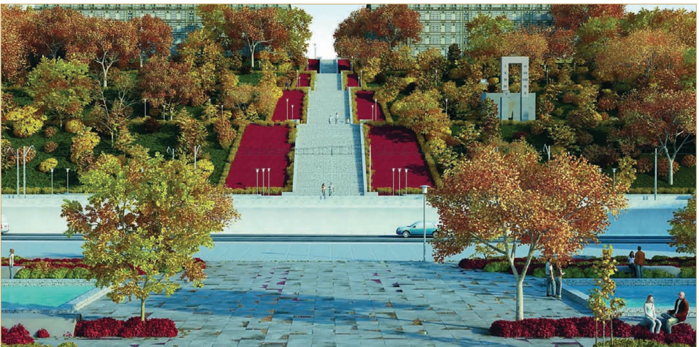
Фрагмент магістерської роботи «Принципи організації меморіальних парків засобами ландшафту» (виконав І. В. Гуменник, керівник — проф. В. І. Проскураков, асист. Ю. Л. Богданова)

Кафедра має загальноновизнану в Україні наукову школу, веде підготовку висококваліфікованих наукових