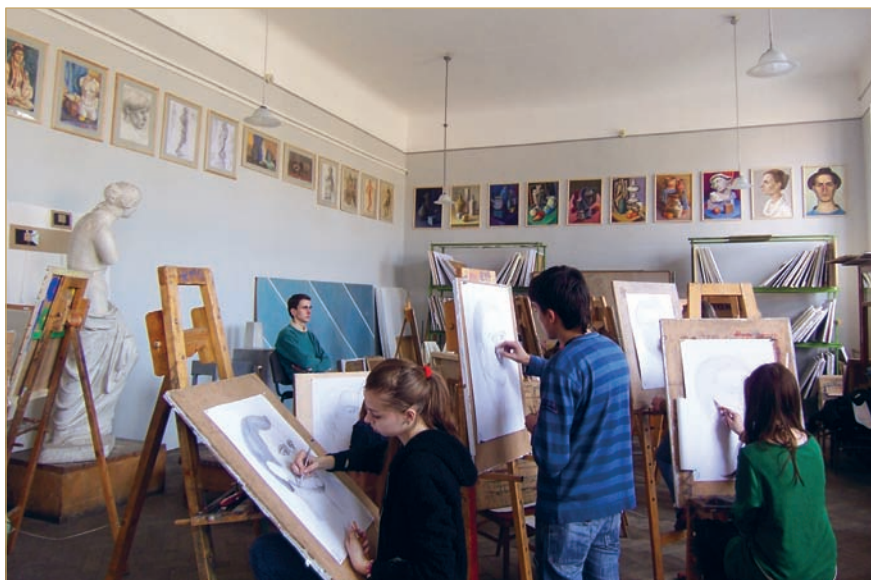
Навчальний процес студентів спеціальності «Дизайн» (кафедра дизайну та основ архітектури)

З початку 1990-х рр. проф. Б. С. Черкес займається питаннями компаративного аналізу архітектури та ідентичності громадських центрів європейських міст. Цій темі він присвятив понад 150 публікацій у відомих