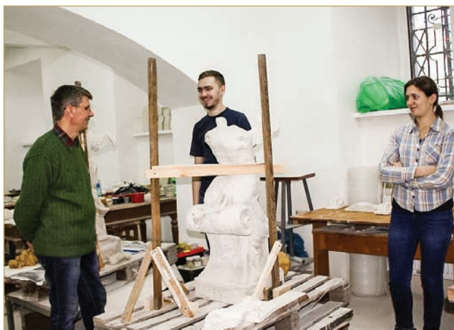
Студенти кафедри реставрації архітектурної та мистецької спадщини під час навчального процесу

В межах цієї кооперації у різних наукових і навчальних заходах взяли участь 320 викладачів і студентів; багато педагогів змогли здійснити інтенсивні наукові дослідження, написати і захистити свої кандидатські та докторські дисертації, завершити і опублікувати монографії. В останні роки було проведено 18 міжнародних студентських воркшопів, зокрема у Варшаві, Венеції, Відні, Граці, Києві, Кракові, Криму, Львові, Москві, Одесі, Парижі, Флоренції та Шанхаї.