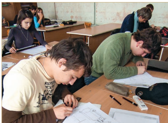
Навчальний процес студентів напряму «Архітектура» (кафедра дизайну та основ архітектури)