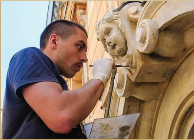
Дипломант відновлює портал ХІХ Львівської політехніки (кафедра реставрації архітектурної та мистецької спадщини)