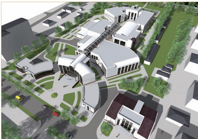
Фрагмент проекту нового громадського центру у Пустомитах (виконав М. М. Грицак, керівник — доц. І. В. Русанова, асист. А. О. Ігнатюк)

Кафедра готує бакалаврів, магістрів і спеціалістів за спеціальністю «Архітектура і містобудування».