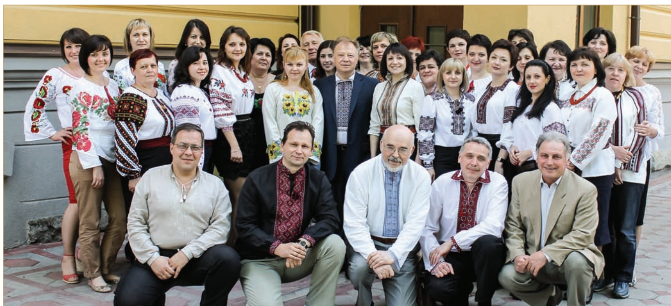
Викладачі та колегія студентів інституту на Великодні свята