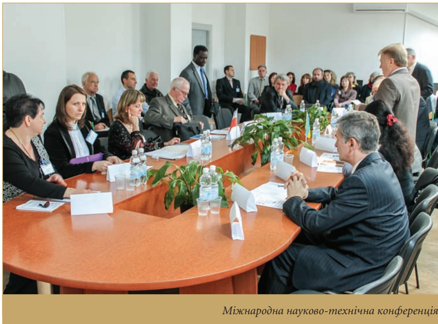
Міжнародна науково-технічна конференція

Виховна та культурно-просвітницька робота є невід'ємною частиною навчального процесу ІППТ і спрямована на формування у студентів високих моральних і культурних якостей, активної громадянської позиції та патріотизму, відродження національно-культурних традицій українського народу, прагнення до здорового способу життя, здатності протистояти асоціальним явищам. Студенти інституту беруть активну участь у традиційних фестивалях «Осінь політехніки» та «Весна політехніки». З цією метою проводяться тематичні вечори, зустрічі з відомими людьми України, Шевченківські читання тощо. В інституті сформовані команди з футболу, волейболу, настільного тенісу та шахів. Студенти у складі збірних команд університету