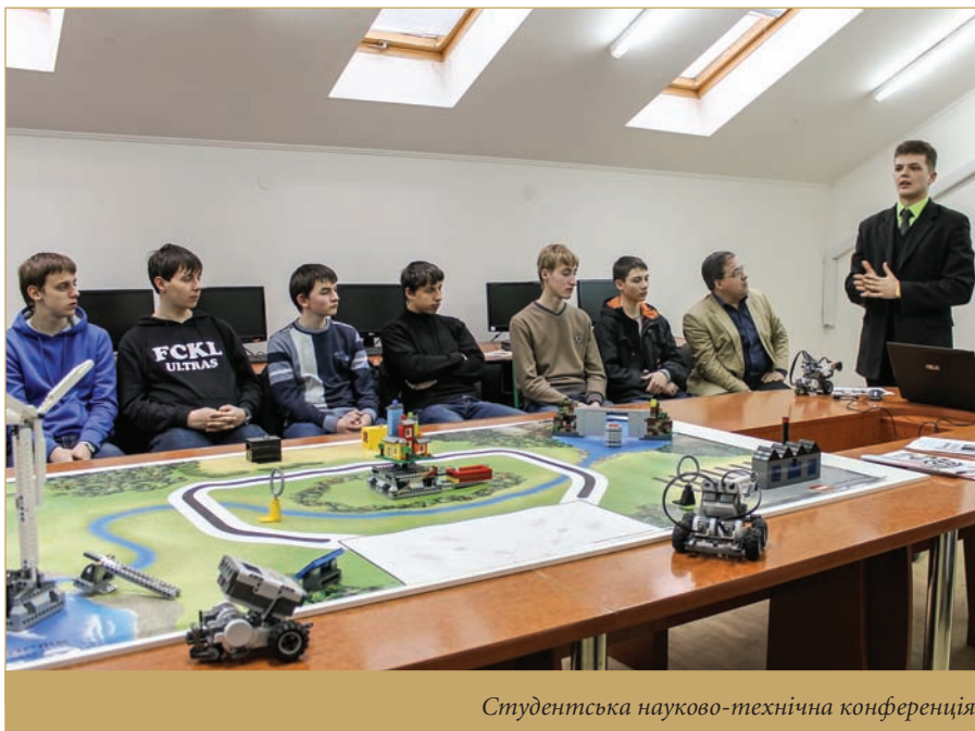
Студентська науково-технічна конференція

Створення і функціонування в інституті Центру моніторингу урбанізованих систем продиктовано вимогою часу. В Україні існує гостра потреба здійснення організаційних перетворень щодо соціально-економічного розвитку територій і населених пунктів,