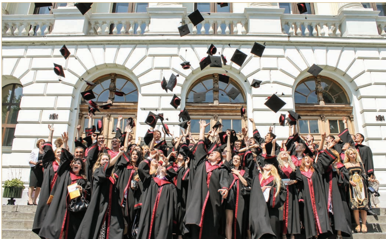
Початок нового етапу життя!

Усі досягнення — це результат спільної злагодженої роботи колективу ІППТ, спрямованої на виховання молодого покоління. Майбутнє інституту твориться з орієнтацією на гасло «Через навчання до успіху!».