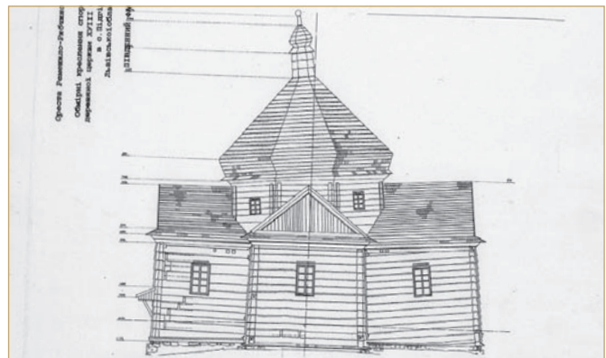
Обмірні креслення південного фасаду споруди дерев'яної церкви кінця XVII ст., яка згоріла у 2006 р., с. Підгірці, Львівська область, 2003 р.

І щиро помолюсь за ріднеє місто, За те, щоб ніколи не було тут тісно Щасливим, усміхненим, щирим, здоровим Моїм рідним і близьким, та й просто знайомим.