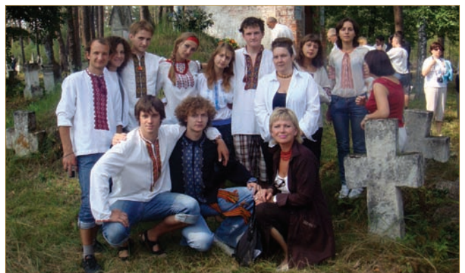
Відновлення українських кладовищ на Любачівщині, 2008 р.