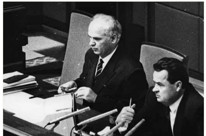
Засідання Верховної Ради України першого скликання. І. С. Плющ та В. В. Дурдинець — перший заступник Голови Верховної Ради України, 1992 р.