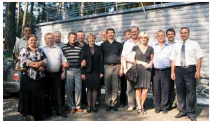
Зустріч із випускниками у Львові, 2009 р.

У своїй діяльності дотримується принципу — «Краще поганий мир, ніж хороша війна» .