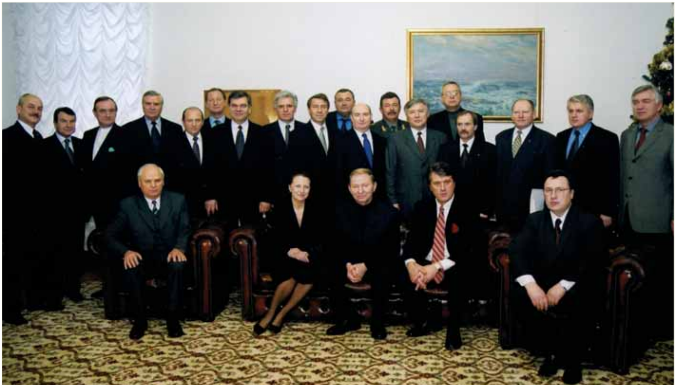
Уряд України із Президентом України Л. Д. Кучмою, 2000 р.

Нині В. В. Дурдинець передає свій багатий життєвий і професійний досвід курсантам Київського національного університету внутрішніх справ, де працює головою наглядової ради, здійснює керівництво Громадською радою при МНС України й очолює асоціацію «Чорнобиль» органів внутрішніх військ МВС України.