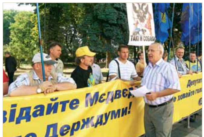
Пікетування Верховної Ради Українською Народною Партією з вимогою прийняти спільну заяву українського парламенту у відповідь на російську інформаційну агресію

Життєве кредо Ярослава Джоджика — відомі слова П'єра Бомарше: «Жити — означає боротися, боротися — означає жити».