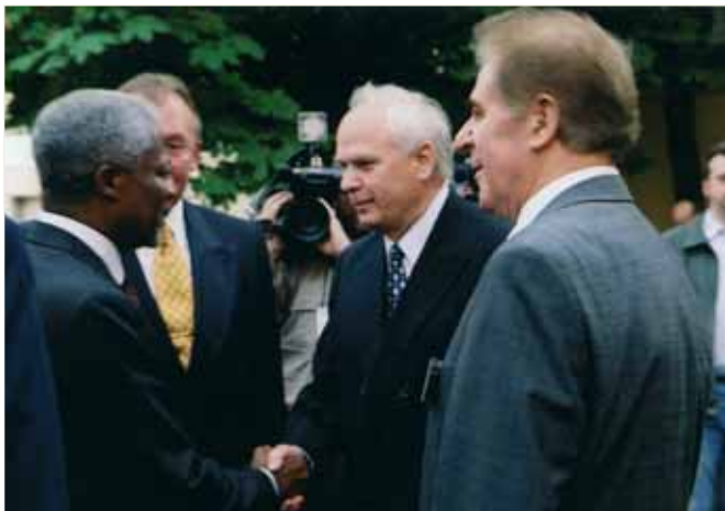
Зустріч у Національному Чорнобильському музеї із Генеральним секретарем ООН Кофі Аненом. Київ, 2001 р.

Високий професіоналізм, цілеспрямованість, порядність, чесність, надзвичайна працездатність, уміння зацікавити своїми ідеями людей та шляхетність Василя Дурдинця дозволили йому стати одним із видатних політичних діячів, які творили нову історію України, як Леонід Кравчук, Леонід Кучма, Іван Плющ. Вони підсилили своїм щирим і героїчним патріотизмом чин творчої та наукової інтелігенції, зрештою волевияв усього нашого народу, наші прагнення до суверенного національного державного життя.