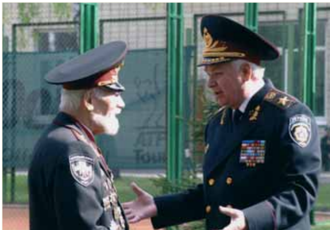
Зустріч із першим деканом юридичного факультету академіком П. П. Михайленком. Київ, 2005 р.

Член Ради національної безпеки і оборони України (1995–2002 рр.), а з грудня 2002 р. до вересня 2003 р. — Надзвичайний і Повноважний Посол України в Угорській Республіці.