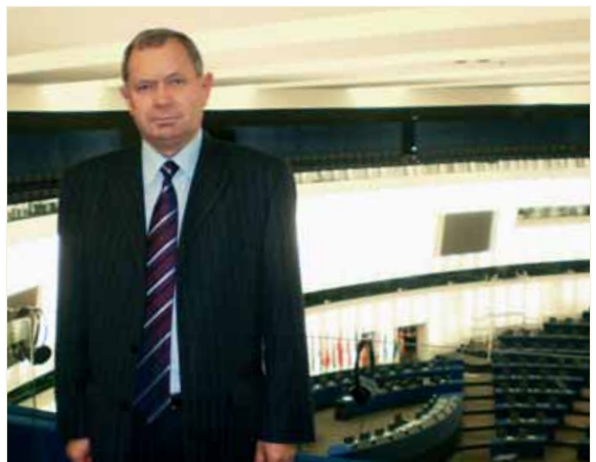
Європарламент, Міжнародна конференція «Інтеграція України в Європу», м. Страсбург, 2009 р.

Одружений, має двох доньок і двох онучок.