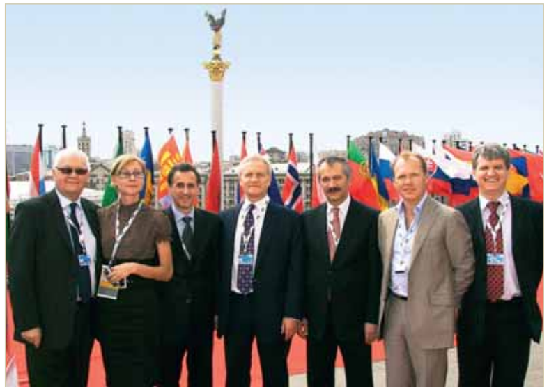
Організатори проведення щорічних зборів ЄБРР, м. Київ, 2008 р.