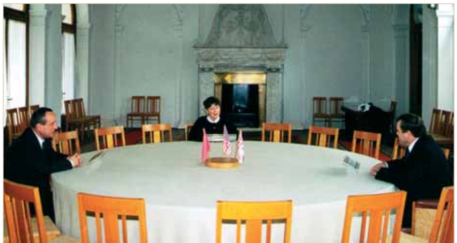
Офіційна зустріч із представниками поліції США з обміну досвідом у розкритті злочинів у сфері охорони навколишнього середовища, м. Ялта, 1997 р.