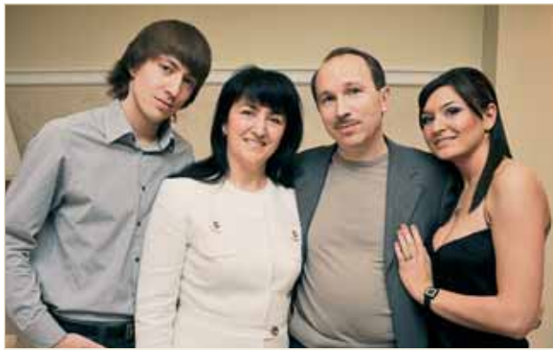
У сімейному колі

Життєве кредо: «Щоб багато досягти — потрібно ставити високі цілі».