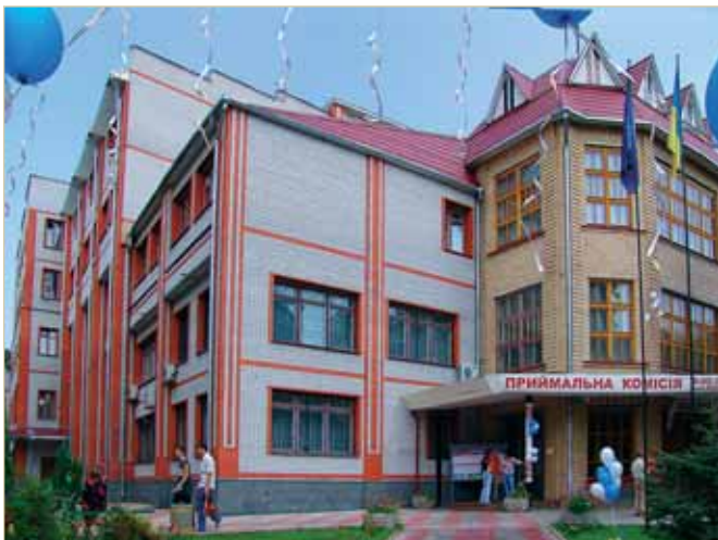
Головний корпус Європейського університету

У 1994 р. ректора Українсько-фінського інституту менеджменту і бізнесу було обрано головою Асоціації навчальних закладів України недержавної форми власності. Відтоді інститут став своєрідним центром нової системи освіти в Україні, а Івана Тимошенка у 1997 р. обрали головою Ради ректорів вищих навчальних закладів недержавної форми власності м. Києва й України, членом Ради ректорів Київського регіону, членом Державної акредитаційної комісії.