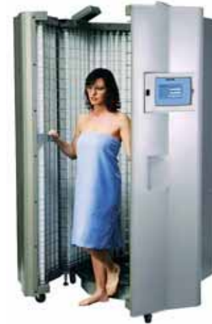
Апарат для фототерапії Daavlin 3 Series

вул. Артема, 25, м. Київ Тел.: +380 (44) 272-11-48, факс: 272-13-75 E-mail: office@psoriasis.com.ua http://www.psoriasis.com.ua