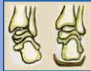
1. Плоскостопість 2. Устілка-супінатор

Звертайтеся. Спеціалісти центру допоможуть Вам подолати біль у спині й ногах