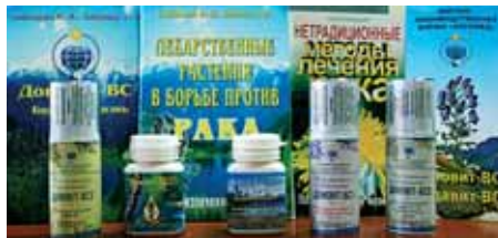
Препарати та книги фірми «АКСОМЕД» завжди мають попит