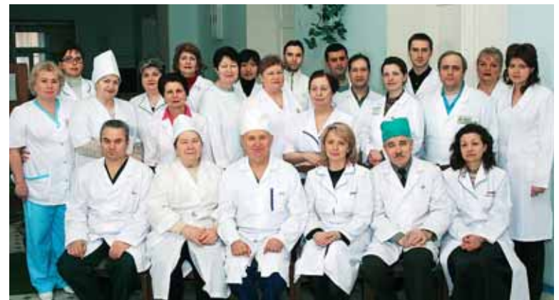
Колектив офтальмологічного відділення Олександрівської клінічної лікарні м. Києва

Центр «Травма ока» цілодобово надає екстрену допомогу при травмах очей та придатків (контузії, поранення, опіки та ін.) На високому технічному та професійному рівні здійснюються операції: факоемульсифікація катаракти (зокрема травматичної); вітректомія; пластика райдужки; видалення внутрішньоочних сторонніх предметів; пластичні операції орбіти, повік та сльозних органів; лазерні втручання.