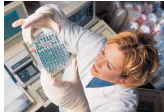
Використання обладнання Roche Diagnostics, Sysmex, Diasorin

– лабораторія Synevo активно займається клінічними випробуваннями в світі. Україна також не виняток, і вже розпочато роботу в цьому напрямку. Довіра з боку іноземних партнерів до лабораторії в Україні свідчить про високий рівень організації та укомплектованості персоналом і устаткуванням.