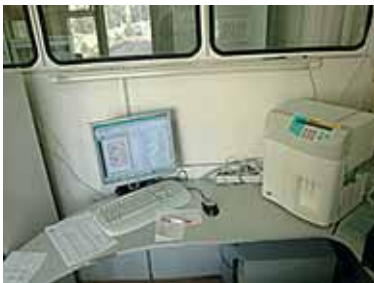
Гематологічний аналізатор (Швейцарія)

ніяк себе не проявляти. При різких змінах на гормональному фоні жінки, стресі, хірургічних втручаннях віруси активуються, викликаючи онкозахворювання, що швидко розвиваються. Щоб зменшити ризик розвитку онкології або принаймні відмовитися від деяких процедур, які також можуть спровокувати онкозахворювання, спеціалісти лабораторії рекомендують зробити аналізи на папілома-віруси.