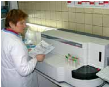
Гормональний автоматичний аналізатор (США)