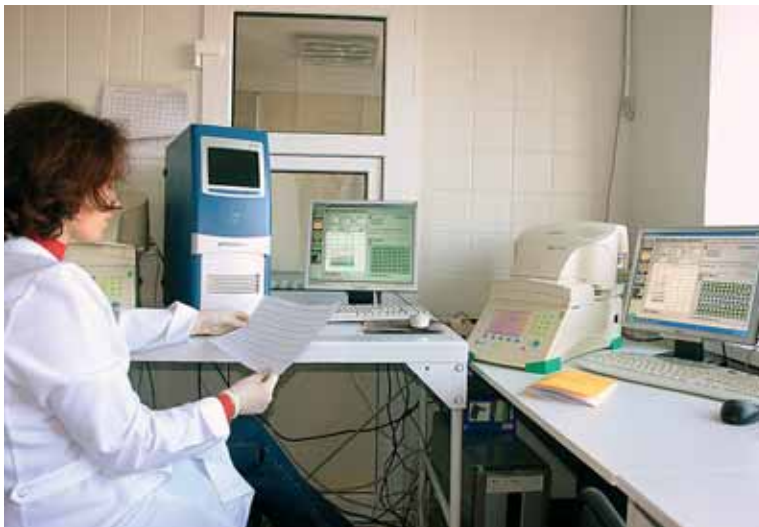
Спеціаліст лабораторії під час роботи на обладнанні «Реал-тайм ПЛР ампліфікатор»

ТОВ «ДНК-лабораторія» — приватна клініко-діагностична лабораторія державного рівня акредитації, заснована в Києві в 2001 р. Основним напрямком роботи лабораторії є ПЛР аналіз (визначення ДНК збудників хвороб). Крім того, лабораторія виконує: загальноклінічні та біохімічні аналізи, дослідження гормонального статусу людини, імуноферментні та ПЛР аналізи на гепатити, герпетичні інфекції, гельмінти, уrogenітальні інфекції, проводить визначення онкомаркерів, аутоімунних та алергічних захворювань. Лабораторія отримала всі необхідні сертифікати, ліцензію МОЗ України, атестат акредитації, акредитацію на роботу з особливо небезпечними інфекціями. Якість усіх