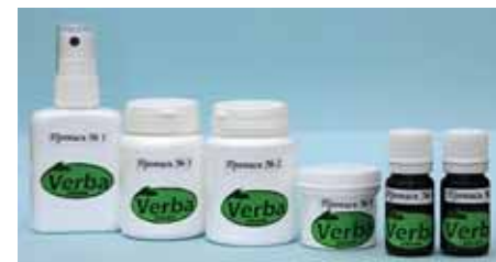
Наші продукти — новий стиль життя для мільйонів хворих цукровим діабетом