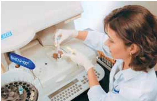
Використання обладнання Roche Diagnostics, Sysmex, Diasorin