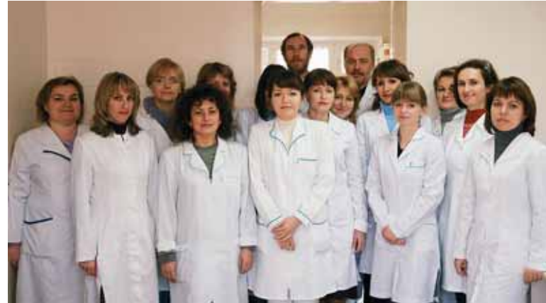
Колектив ТОВ «ДНК-Лабораторія»

Лабораторія працює із стабільними та відомими постачальниками реагентів. З багатьох методик спеціалісти лабораторії радилися з розробниками тест-систем і детально вивчили суть реакцій, що відбуваються. Введений внутрішній контроль на тест-системи, реагенти, що постачаються до лабораторії, допомагає контролювати