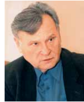
Потопальський Анатолій Іванович

У 1959 А. І. Потопальський відкрив і впродовж усіх подальших років продовжує розробляти новий науковий напрямок цілеспрямованого покращення структури природних біологічно активних речовин з одержанням препаратів, які на молекулярному і генетичному рівні оздоровлюють людину і довкілля. В Інституті молекулярної біології і генетики НАН України та Інституті оздоровлення і відродження народів України одержані оригінальні препарати з протипухлинною, противірусною (зокрема і проти СНІДу), імунорегулюючою і протирадіаційною дією, розроблено способи використання їх впливу на біологічні процеси в медицині, ветеринарії, сільському господарстві. Найбільш відомі з них — «Амітозин» , що перешкоджає поділу клітин злоякісних пухлин, викликає їх старіння і природну смерть, та «Ізатізон» , який успішно використовується для попередження і лікування масових вірусних і мікробно-вірусних хвороб і пухлин у ветеринарії, медицині і рослинництві. Обидва препарати захищені авторськими свідоцтвами і багатьма закордонними патентами.