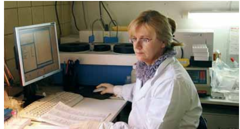
Використання біохімічного аналізатора Flexor (Нідерланди) у лабораторії