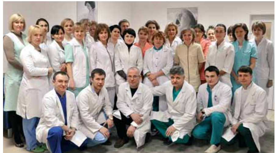
Колектив Київського міського пологового будинку № 7

E-mail: pb7@health.kiev.ua, www.pb7.at.ua