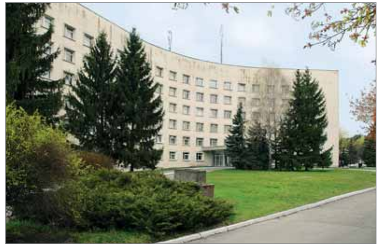
КЗ КОР «Київська обласна лікарня № 2»

пров. Нестерівський, 13/19, м. Київ, 04053 Тел.: +380 (44) 272-63-08 (приймальня головного лікаря) Тел.: +380 (44) 443-59-67 (приймальне відділення) E-mail: kol2@i.ua