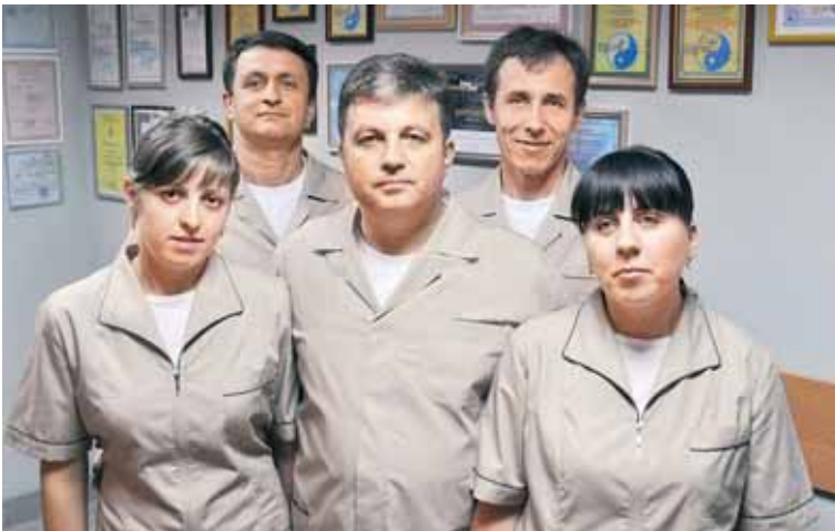
Колектив «Клініки доктора Довгого»

З 1999 р. аспірант кафедри неврології та рефлексотерапії Київської медичної академії післядипломної освіти ім. П. Л. Шупика. У 2003 році захистив дисертацію «Консервативне лікування неврологічних проявів дегенеративно-дистрофічних захворювань попереково-крижового відділу хребта, ускладнених грижами дисків». Працює в академії доцентом кафедри неврології та рефлексотерапії.