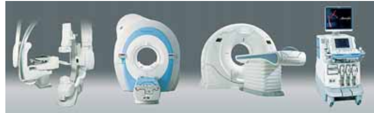
Лінійка обладнання Toshiba Medical Systems

ЗАТ «Укрмедтехніка» не лише задовольняє потреби замовників, а й пропонує нові ідеї, щоб перевершити їхні очікування.