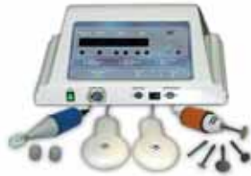
Апарат для фізіотерапії комбінований «MIT-11»

вул. Почайнинська, 23, оф. 2, м. Київ, 04070 Тел.: +380 (44) 425-91-22 (23), 531-37-09; т./ф: 531-37-08 E-mail: medintech@list.ru, http: www.medintech.com