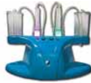
Апарат для приготування синглетно-кисневих коктейлів «MIT-C»

За час діяльності НМЦ «МЕДИТЕХ» досягнуто значних результатів , а саме: