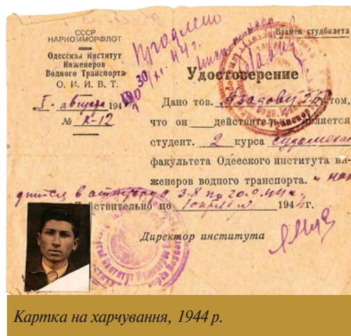
Картка на харчування, 1944 р.