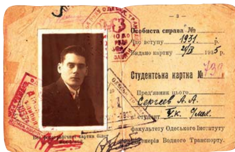
Студентський квиток, 1931–1935 рр.

крив два десятки дослідницьких і навчальних лабораторій, які очолювали видатні вчені. Серед них: професор Г. К. Сулов — провідний фахівець у галузі механіки; 22-річний професор Ф. Р. Гантмахер — теоретик реактивних снарядів, лауреат Державної премії; професор Г. Бекк — учень і послідовник всесвітньовідомого вченого Нільса Бора; професор Г. Є. Павленко — видатний фахівець у галузі