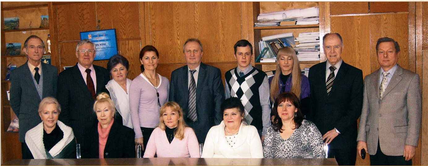
Колектив Науково-дослідного інституту фундаментальних та прикладних досліджень