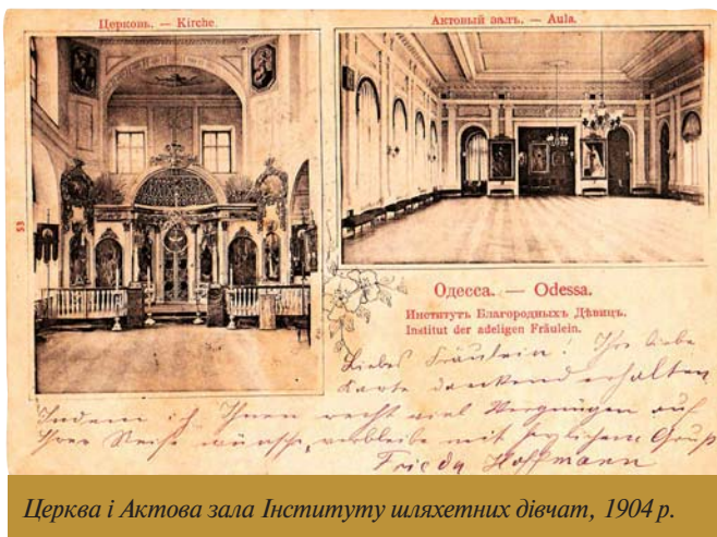
Церква і Актова зала Інституту шляхетних дівчат, 1904 р.