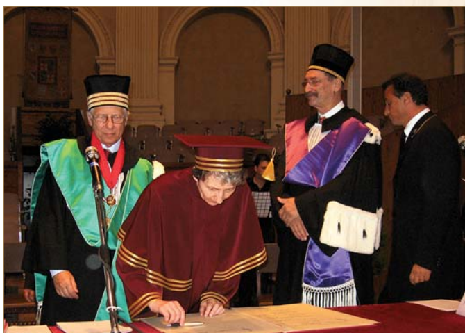
Підписання Болонської угоди, 2007 р.

Чимала роль у системі організації навчального процесу відводиться питанню контролю знань студентів. Використовуючи досвід провідних університетів