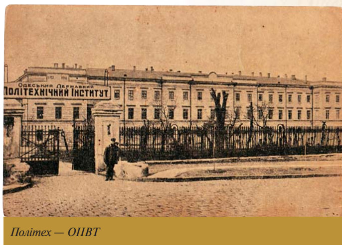
Політех — ОПВТ