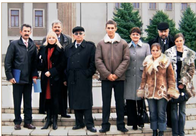
Делегація від ОНМУ на Міжнародній конференції «Євросерегійон — Нижній Дунай»

Університет готує спеціалістів морської галузі для іноземних держав ще з 1950 р. За цей час підготовлено понад 1200 фахівців для 73 країн Європи, Азії, Африки та Америки. Зараз в ОНМУ навчаються студенти із 20 країн світу. Найкращою характеристикою усієї роботи з підготовки для іноземних держав є діяльність випускників університету. Багато з них посідають у себе на батьківщині керівні посади в системі морського та річкового транспорту. Так Ля Інчень — академік Академії наук КНР, Лі Цзянь — віце-президент Загальнокитайської кораблебудівної корпорації. Випускник Чан Ван Лі довгий час працював заступником міністра транспорту В'єтнаму,