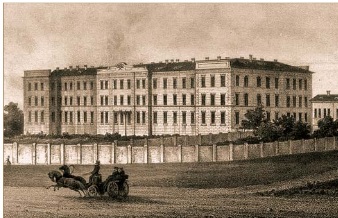
Інститут шляхетних дівчат, 1890 р.

Потреби народного господарства СРСР і Радянської України, викликані бурхливим розвитком мережі водного (річкового й морського) транспорту, внутрішніх і зовнішніх вантажоперевезень призвели до необхідності утворення Одеського інституту водного транспорту (далі — ОІВТ, ОІВТ, ОІМФ, ОНМУ). Рішення про його заснування в Україні спершу було прийнято 9 січня 1930 р. конференцією Народного комісаріату шляхів сполучень (далі — НКШС) УСРР, а згодом уже конкретніше цим питанням опікувалася спеціальна нарада, що відбулася 13 квітня 1930 р. Серед учасників наради, які стали фундаторами «Водного» (так інститут назвали в народі, й до сьогодні ця традиція зберігається) були: голова Центрального управління кадрами НКШС, керівництво партійного комітету та