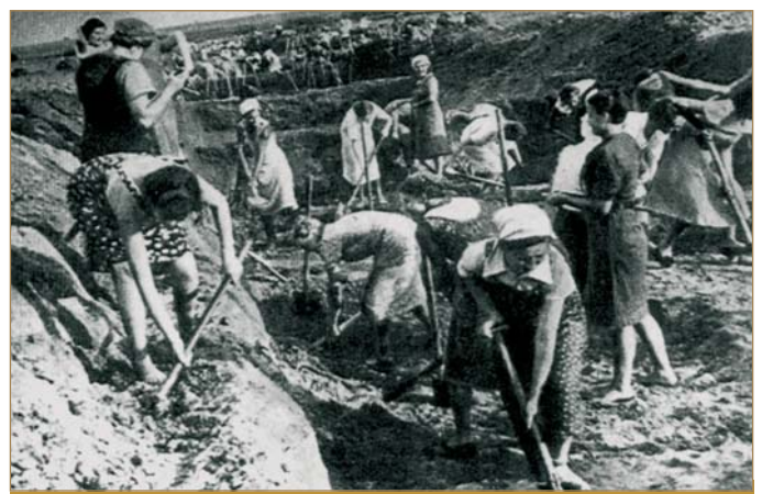
На будівництві протитанкового рову, 1941 р.