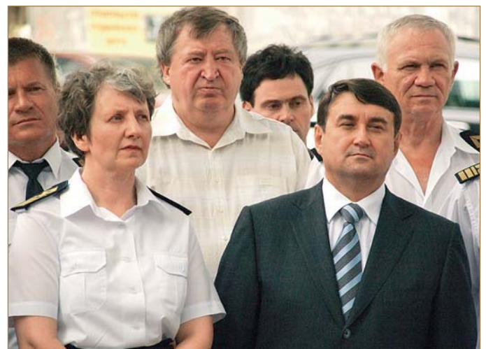
Ректор ОНМУ І. В. Морозова та Міністр транспорту Російської Федерації І. Є. Левітін. Відкриття меморіальних дощок Героям Соціалістичної Праці, випускникам «Водного» Т. Б. Гуженку і О. Є. Данченку, 2008 р.

Діяльність ДМС здійснюється у багатьох напрямках, зокрема в таких: підготовка іноземних громадян до вступу у ВНЗ України (підготовчі курси для іноземців), підготовка фахівців для зарубіжних країн (бакалаврів,