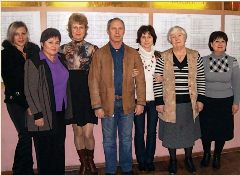
Співробітники навчально-методичного відділу

світу, було розроблено систему накопичувальної оцінки знань, за якої 50% оцінки студент може отримати, працюючи над засвоєнням окремих видів академічної діяльності (лабораторний практикум, семінарські та практичні заняття, розрахунково-графічні завдання тощо), а решта 50% — за результатом підсумкового контролю. Така система давно існує в багатьох, зокрема європейських, країнах, і довела свою ефективність. Вона дає можливість інтенсифікувати навчальний процес, систематизувати засвоєння навчального матеріалу і психологічно розвантажити студентів.