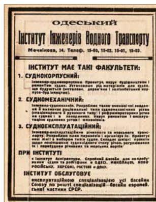
Оголошення про набір, 1936 р.