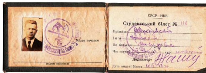
Студентський квиток, 1938 р.

За розпорядженням Наркомату морського транспорту інститут було заплановано евакуювати до Ростова-на-Дону, а згодом до Махачкалі. На початку серпня 1941 р. розпочалася важка і довга дорога на Схід, яка тривала більше двох місяців. Після нелегких випробувань, організаційних, побутових, кліматичних та моральних, кінцевим