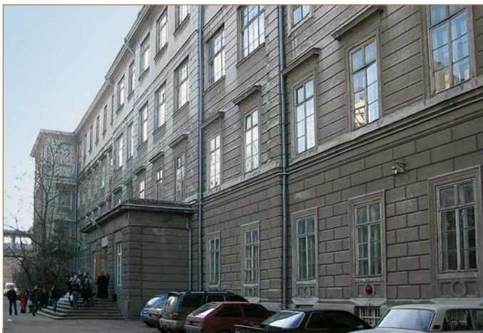
Старий корпус у 1990-х роках