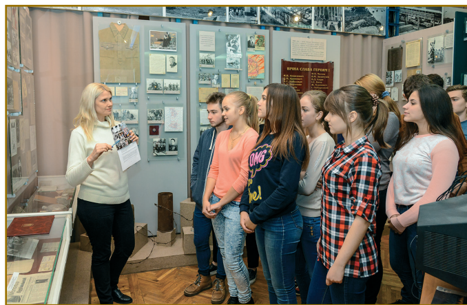
Екскурсія для першокурсників економічного факультету