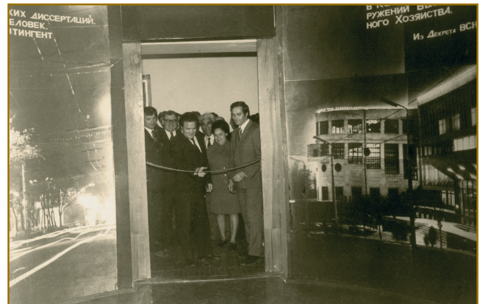
Відкриття музею, 30 квітня 1975 р.