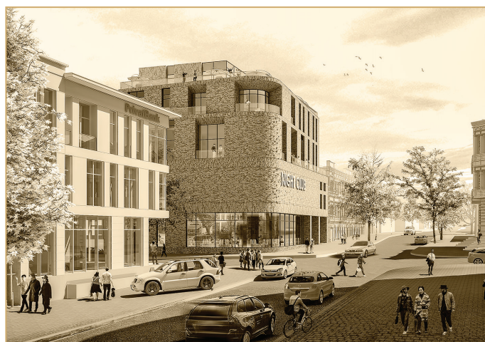
Розважальний комплекс на вул. Старокозацькій, 20 в м. Дніпрі