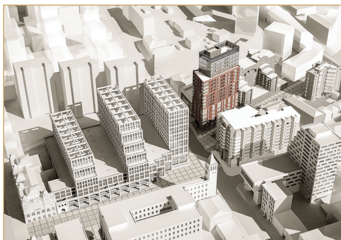
Житловий комплекс на вул. Шевченка, 51 в м. Дніпрі